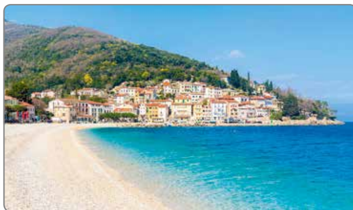
APARTMÁNY CHORVATSKO ..... str. 62-98