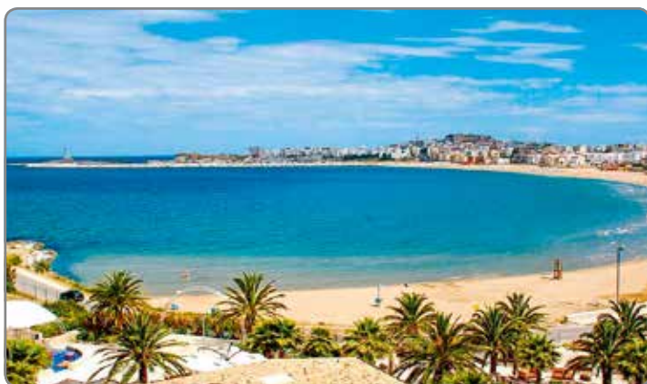
APARTMÁNY ITÁLIE ..... str. 42-60