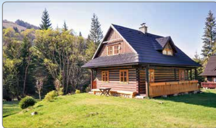
CHATY A CHALUPY SLOVENSKO ..... str. 38-41