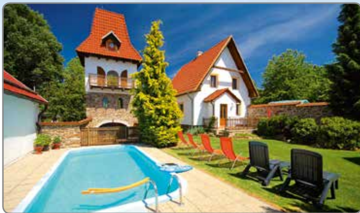
CHATY, CHALUPY A REKREAČNÍ AREÁLY ČESKO ..... str. 6-37