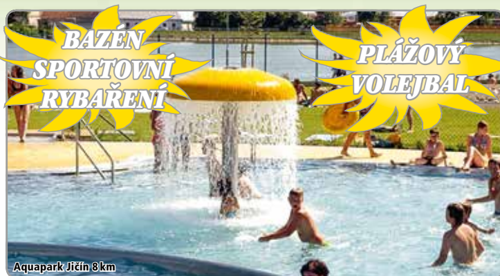
Aquapark Jičín 8 km

Ubytování: pro firemní akce, dětské kolektivy a tábory nabízíme ubytování v jednoduše zařízených chatkách typ Standard . Blíže informace včetně cen najdete na www.sklar-ostruzno.cz/pro-skupiny .