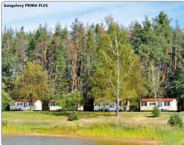
bungalovy PRIMA PLUS

Bungalov SUN - max. obsazení 4 osoby. Velikost bungalovu 11 m 2 , ložnice s manželským lůžkem, ložnice s patrovým lůžkem. Koupelna se sprchou a WC. Vnější veranda (přístřešek před bungalovem) 12 m 2 - kuchyň. kout s plyn. sporákem (2 plot.), lednicí a mikrovlnnou troubou. El. bojler. Venkovní posezení se zahradním nábytkem a slunečníkem.