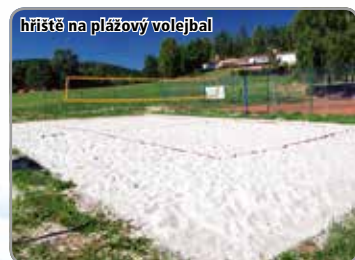
hřiště na plážový volejbal