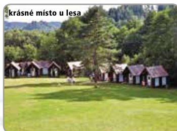
krásné místo u lesa